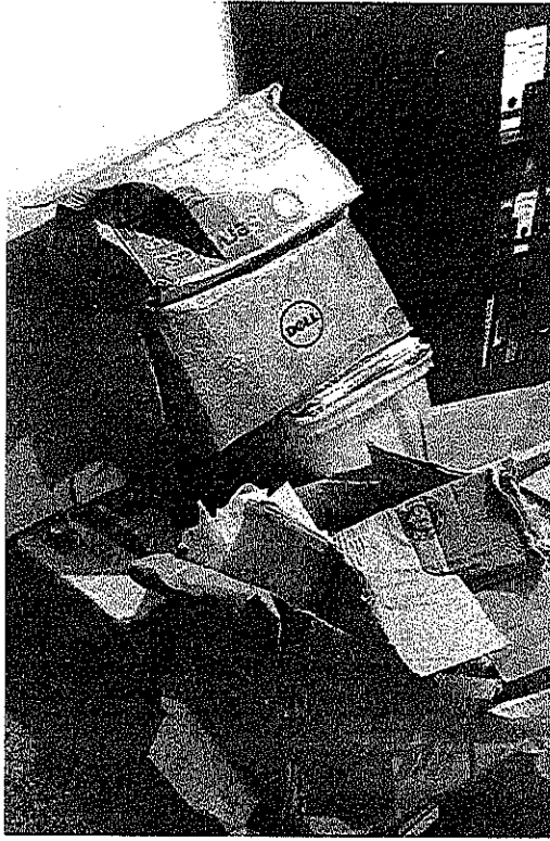
*Foto de cómo se encontraba la mayoría de papelería en cajas de cartón y plásticas en deterioro.